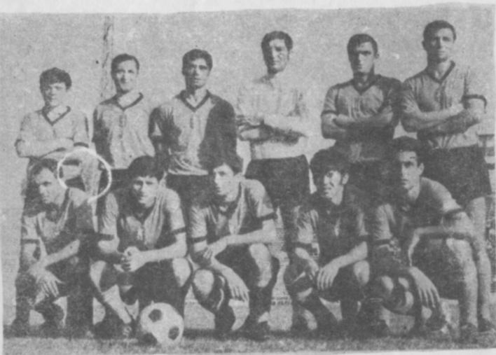
Отборът на „Ботев“